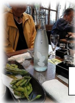
大嶺酒造 「夏純かすみ生酒」

【大嶺酒造】 山口県 アルコール度数 14.5 「夏純かすみ生酒」 50年の眠りから復活した幻の蔵 契約栽培された山口県産の山田錦を 50%まで磨き、手間 暇かけて醸しています。 底に沈んだ「もろみ」をゆっくりと上下させてグラスに注 ぎます。 程よい酸味があり微発泡性を感じさせます。