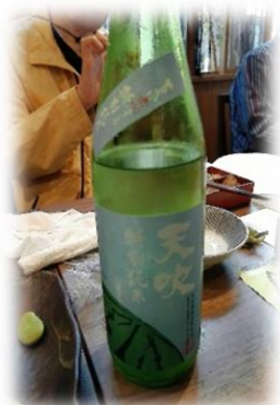
天吹酒造 「夏に恋する特別純米」生

【天吹酒造】 佐賀県 アルコール度数 16.0 「夏に恋する特別純米」 300年の長い歴史を持つ天吹酒造の夏酒 山田錦を 60%まで磨き日本酒度+13まで発酵させた 辛口酒です。 夏の酒をイメージさせたスイカのラベルがユニークです。 常温近くなると更に辛さが増します。